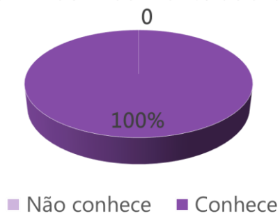
Gráfico 2 - Conhecimento sobre a PAE