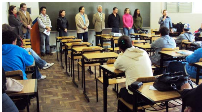
Dirigentes prestigiam aula inaugural do curso de espanhol