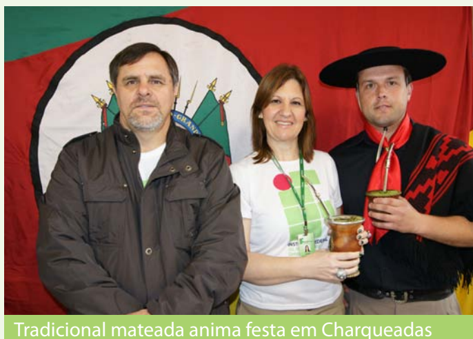
Tradicional mateada anima festa em Charqueadas

No dia 11 de setembro, o campus Charqueadas do Instituto Federal Sul-rio-grandense completou quatro anos de atividades. Para comemorar a data, a direção preparou uma intensa programação. Mateada, apresentações artísticas e um torneio de xadrez estiveram entre as principais atrações da festa de aniversário da escola.