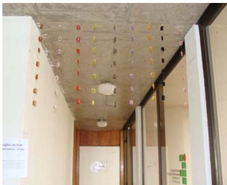
Minimalismo é retratado na prática