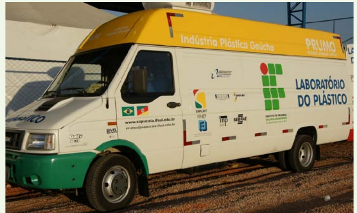
Veículo foi uma das atrações entre os visitantes

O furgão tem como objetivo prestar atendimento tecnológico para garantir a melhoria da produtividade e qualidade dos produtos e processos de micro e pequenas empresas do setor plástico no Rio Grande do Sul. Bem aparelhado, é capaz de realizar diagnósticos como índice de fluidez; resistência à tração, compressão, flexão e ao impacto; dureza shore A e D; Charpy e Izod; coeficiente de atrito; densidade; umidade e cor.