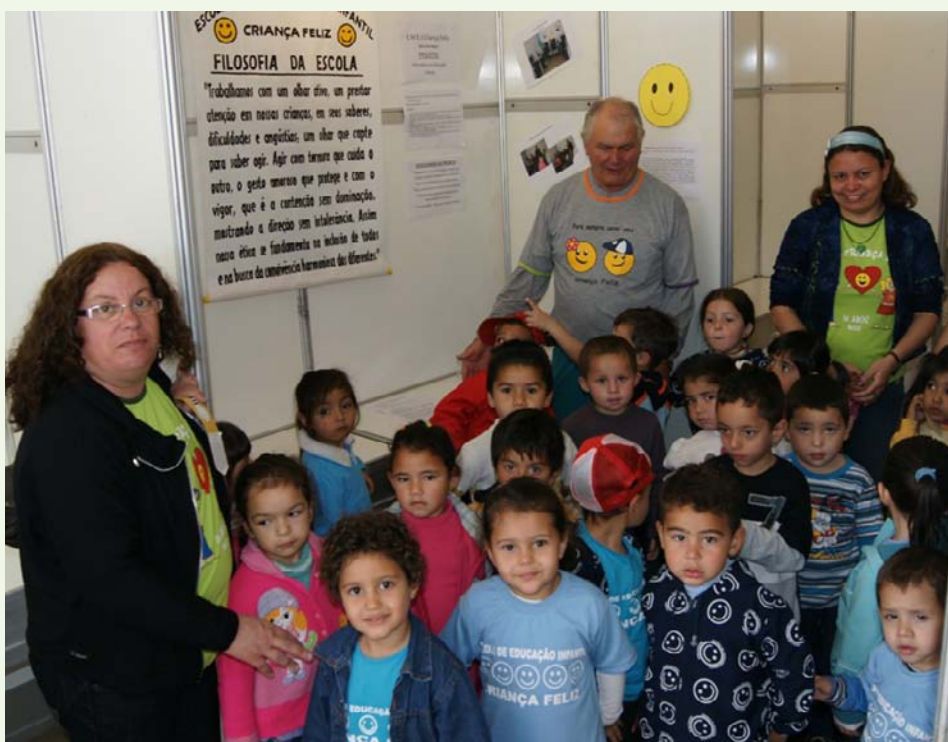
Mocitec coloca ciência e tecnologia ao alcance das crianças

As atividades tiveram início no ano passado. Um ano depois, os laboratórios foram reformulados e ganharam novos equipamentos de informática, mobiliários e acesso à Internet. Mas o objetivo é ir ainda mais longe.