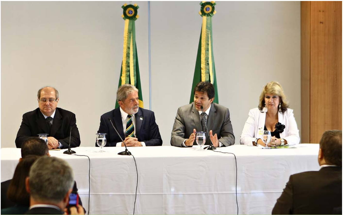
Presidente Luiz Inácio Lula da Silva concede maior autonomia aos institutos federais de educação, ciência e tecnologia