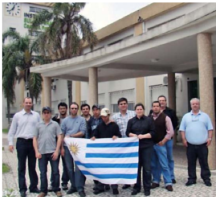
Relação entre Brasil e Uruguai fortalecida pela parceria