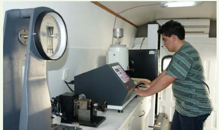
Equipamentos possibilitam diagnósticos sobre o plástico