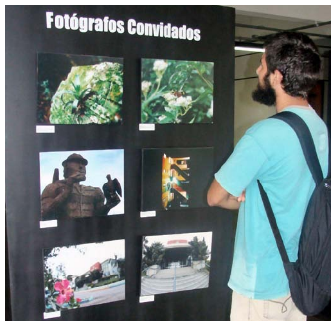
Mostra exhibe talento de fotógrafos de Sapucaia do Sul

A mostra integrou as comemorações dos 49 anos de Sapucaia do Sul e ficou aberta à visitação até 1º de outubro.