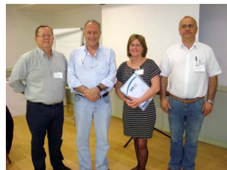
Equipe da DPO aprimora conhecimentos

visando a prevenção de falhas e adoção de técnicas corretas de reparo. Estes novos conhecimentos auxiliarão a DPO em seu atendimento, fiscalização e orientação técnica aos campi .