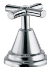
Acabamento para Registros