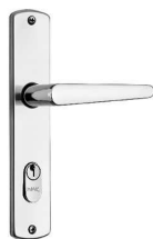
Fechadura (acabamento cromado)

A CONTRATADA deverá entregar à FISCALIZAÇÃO duas vias das chaves de cada porta, em uma plaqueta de alumínio 2x4cm com argola de aço, diâmetro 2,5cm. Na plaqueta deverá ser gravado o número da porta correspondente.