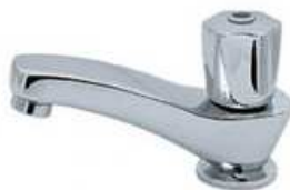
Torneira para lavatórios

As torneiras para os lavatórios serão de mesa, código C50f 1194, marca Forusi ou similar, com acabamento cromado.