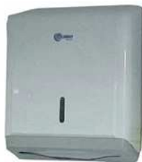
Porta papel toalha interfolha

Deverá ser instalado dispenser para papel toalha interfolha, em polipropileno, para papel toalha tanto de 2 como de 3 dobras, localizados acima dos lavatórios, nos sanitários da sala de terceirizados.