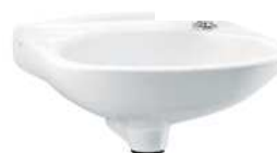
Lavatório de louça com sifão em PVC.