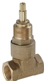
Registro de gaveta