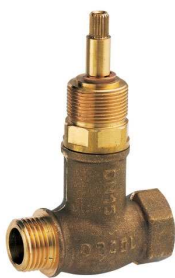
Registro de pressão

Os acabamentos para registros serão da linha Pertutti, código 00271706, marca Docol, ou similar, com acabamento cromado.