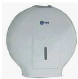
Dispenser para rolo de papel higiênico

Deverá ser instalado dispenser para rolo de papel higiênico, em polipropileno, para rolos de 300m e diâmetro até 220mm, localizados dentro dos box das bacias sanitários da sala de terceirizados.