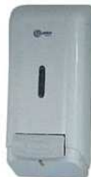
Dispenser para sabonete líquido

Deverá ser instalado dispenser para sabonete líquido, em polipropileno, com capacidade mínima para 700ml e botão dosador, localizados acima dos lavatórios, nos sanitários da sala de terceirizados.