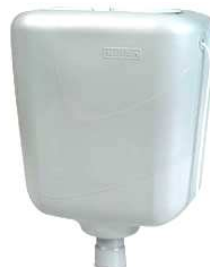
Caixa de descarga plástica