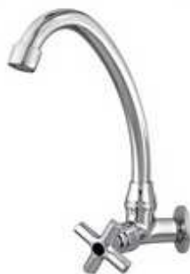
Torneira da cozinha

C37 Light 3159, marca Forusi ou similar, com acabamento cromado.