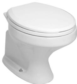
Bacia sanitária convencional

O sistema de descarga será com caixa de descarga plástica, do tipo aparente, com capacidade para 6,8 litros, da marca Astra, ou similar, cor branca, com tubo de descarga e acessórios necessários para instalação.