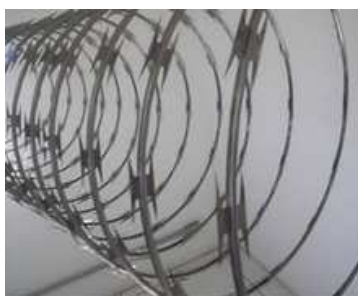
Concertina em aço galvanizado

Aplicação: Nos muros e portão de abrir, conforme projeto específico.