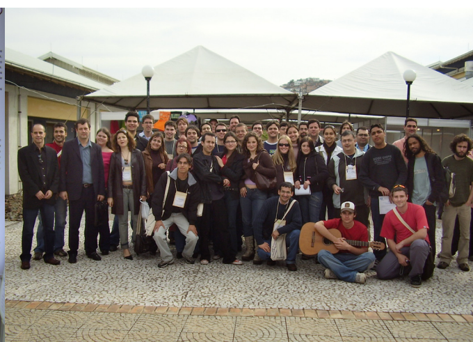
Representantes do CEFET -RS na Jornada