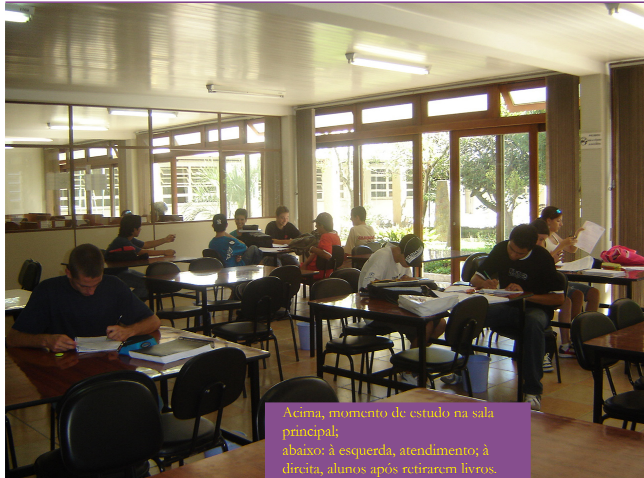
Acima, momento de estudo na sala principal; abaixo: à esquerda, atendimento; à direita, alunos após retirarem livros.