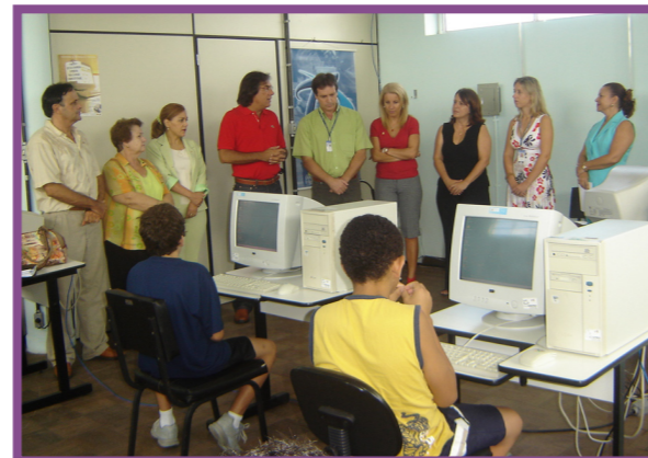
Inclusão digital: aula inaugural

A Casa Lar Santa Cruz abriga meninos em situação de risco, sob medida de proteção. Por isso, iniciativas como essas são de grande valia para o processo de formação e desenvolvimento intelectual e profissional dos meninos beneficiados pelo projeto.