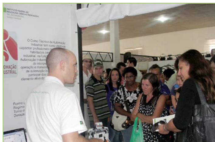
Projetos desenvolvidos na escola chamaram a atenção do público