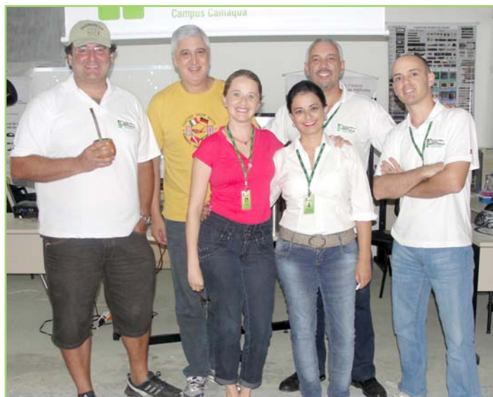
Participação reforça integração entre campus e comunidade

Com muita criatividade, o campus apresentou o projeto de astronomia Céus do Sul, a Lousa Digital e o robô Lego Mindstorms. As atrações encantaram o público que visitou o evento. Segundo os organizadores, em três dias, cerca de 18 mil pessoas circularam pelos pavilhões da 8ª Festa do Arroz.