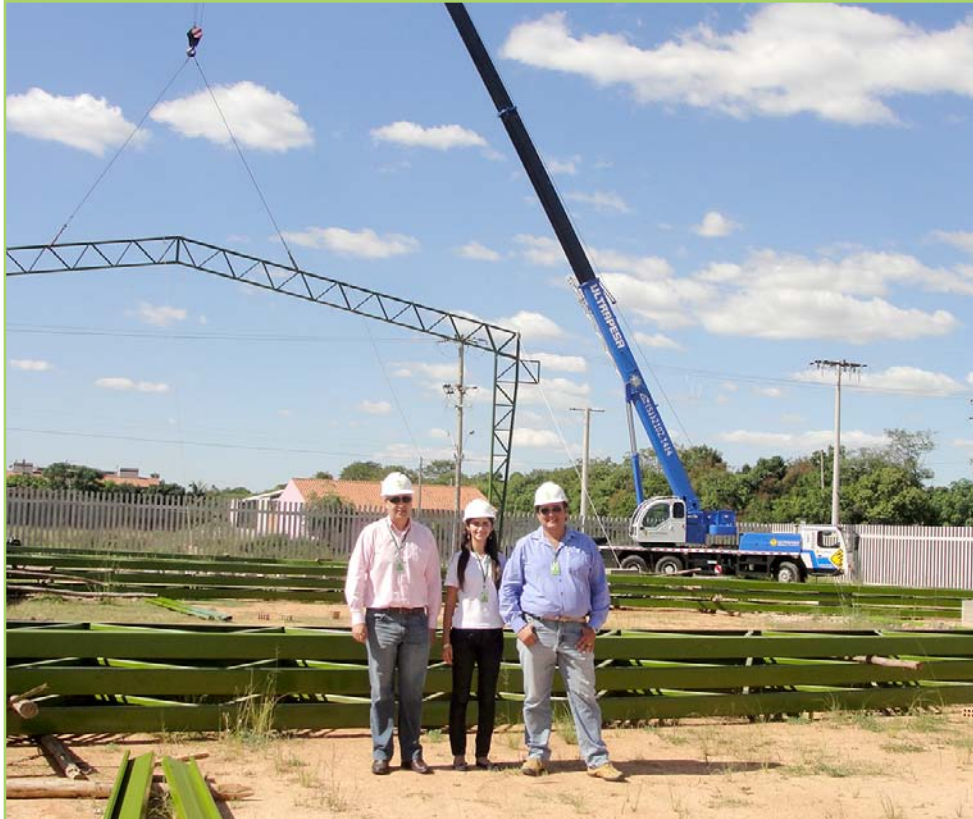
Projeto conta com investimentos de mais de R$ 1,6 milhão

Mais uma etapa da construção da quadra poliesportiva do campus Camaquã do IFSul foi concluída. No dia 6, a empresa responsável pela obra colocou a estrutura metálica da futura cancha, que deverá ser entregue no dia 17 de julho. Mais de R$1,6 milhão serão investidos até o término do projeto.