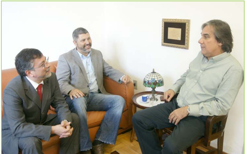
Desenvolvimento regional foi o tema central da reunião

Em visita ao gabinete do reitor, dirigentes do ILDB afirmaram que a pro-