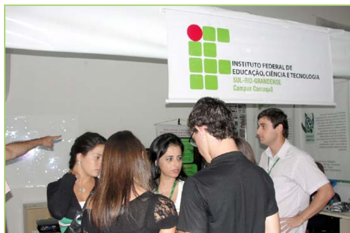
Estande do campus foi um dos mais visitados no evento deste ano