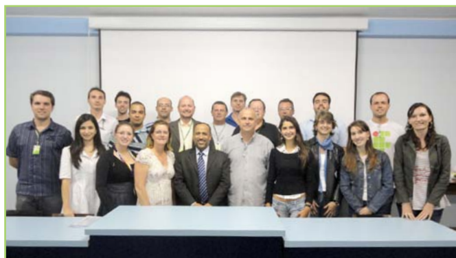
Iniciativa da DPO vai qualificar servidores do setor e dos campi

A Diretoria de Projetos e Obras (DPO) promoveu, entre os dias 11 e 13 deste mês, curso In Company de Fiscalização de Obras Públicas e Serviços de Engenharia. O objetivo da iniciativa foi aprimorar conhecimentos e capacitar servidores técnicos da própria DPO e dos campi Pelotas, Sapucaia do Sul, Charqueadas, Passo Fundo, Camaquã e Venâncio Aires.