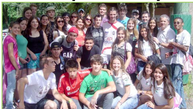
Estudantes prestigiam evento de punhobol na capital

Nada de futsal, basquete ou vôlei. O esporte do momento e que está conquistando cada vez mais a gurizada no campus Camaquã é o punhobol. A modalidade, inclusive, já faz parte das aulas regulares de Educação Física ministradas na escola, que pode ser a primeira do Instituto Federal Sul-rio-grandense a formar equipes para disputas oficiais.