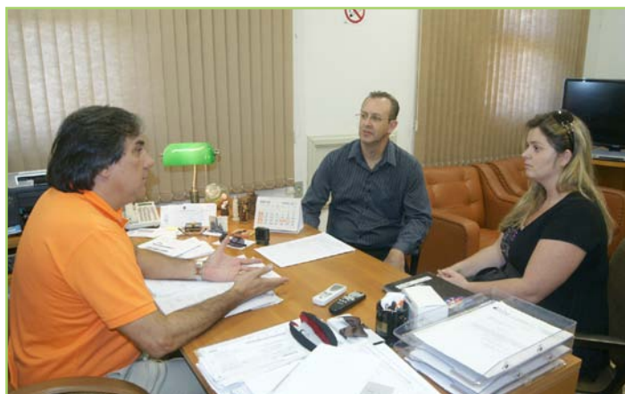
Brod confirma apoio ao Pré-Vestibular nos Bairros

Desde 2006, quando teve início, o Pré-Vestibular nos Bairros atendeu cerca de 4 mil alunos, sendo que 10% destes estudantes já estão cursando uma universidade.