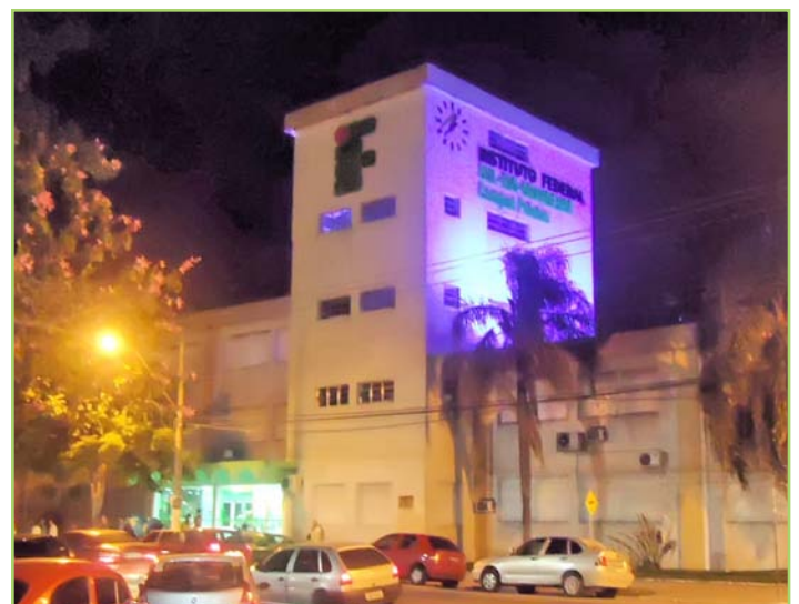
Tradicional símbolo do campus também fez parte da campanha

Para a direção-geral do campus Pelotas, a iniciativa demonstra o papel da instituição na construção de uma comunidade mais consciente a respeito desse tema ainda pouco debatido socialmente.