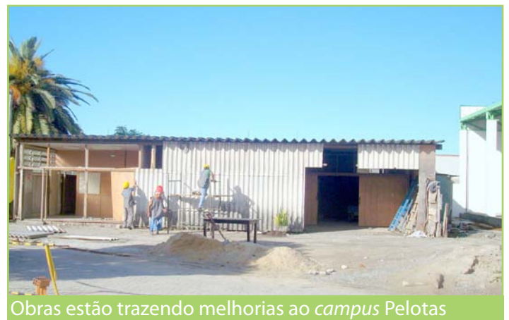
Obras estão trazendo melhorias ao campus Pelotas

A segunda etapa, já iniciada, contempla a construção de um prédio com três pavimentos, numa área de 813,49 metros quadrados, onde está previsto também o novo espaço da coordenação de Almoarifado. O local contará ainda com