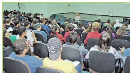
Auditério do campus ficou lotado durante o debate

“Temos consciência de que não esgotamos essa temática. É necessário continuar trabalhando sobre abordagens educativas, de promoção de uma cultura de paz, incentivando a perspectiva de uma sociedade humanista”, sugere.