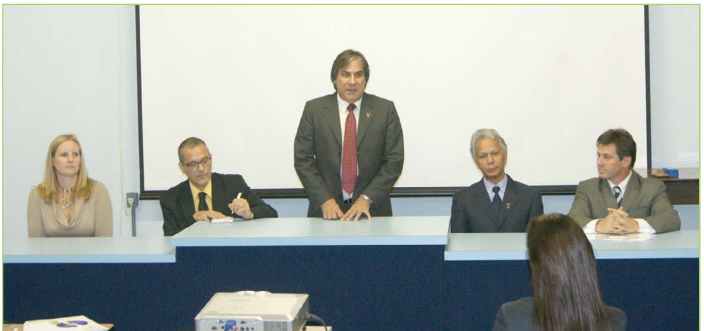
IFSul faz parte de ação coletiva para o desenvolvimento das regiões de fronteira