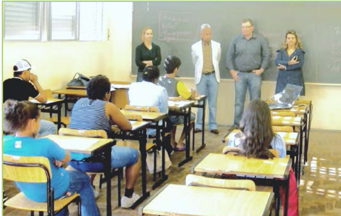
Projeto de inclusão beneficia jovens em situação de vulnerabilidade social

As aulas de espanhol para jovens assistidos pelas Casas de Acolhimento da prefeitura de Pelotas começaram no dia 18 deste mês. O projeto é fruto de uma parceria entre o Instituto Federal Sul-rio-grandense e o executivo. Atualmente, 44 adolescentes estão sendo beneficiados pela iniciativa.