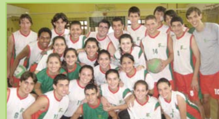
Campeões comemoram o título

Nos dias 30 de abril e 1º de maio, o campus Pelotas do Instituto Federal Sul-rio-grandense sediou a primeira etapa do 18º Circuito da Amizade de Voleibol. A competição, que já vem sendo realizada há algum tempo em outras escolas, é inédita na instituição.