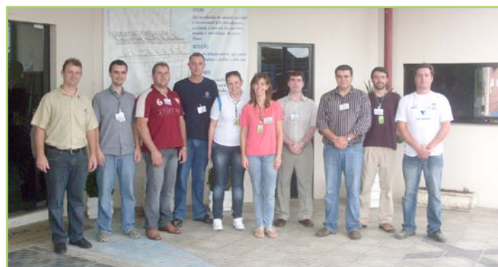
Visitas técnicas complementam trabalho em sala de aula

Professores do campus Venâncio Aires do IFSul participaram no dia 1º de uma visita técnica de reconhecimento à Venax, uma das principais empresas do município no ramo de eletrodomésticos.