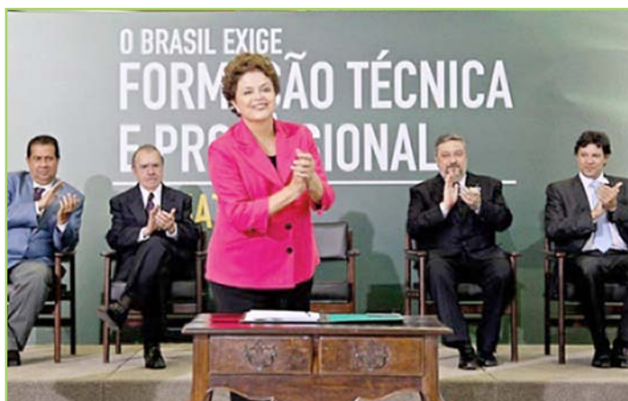
A presidente lembrou que a perspectiva de desenvolvimento cria a necessidade de mão-de-obra qualificada