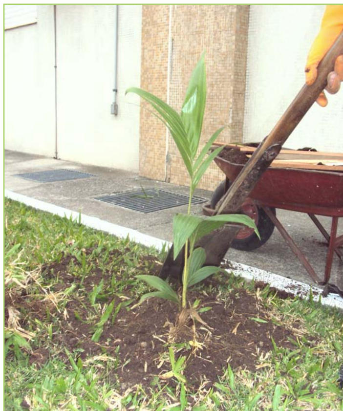
Trabalho de arborização conta com o plantio de diferentes espécies