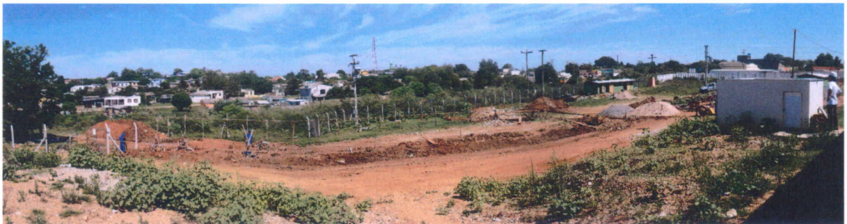
Vista do Canteiro de Obras em 16.02.2012