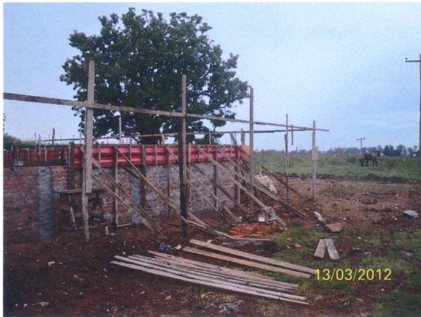
Alvenaria de contenção entre os pilares P21 e P22